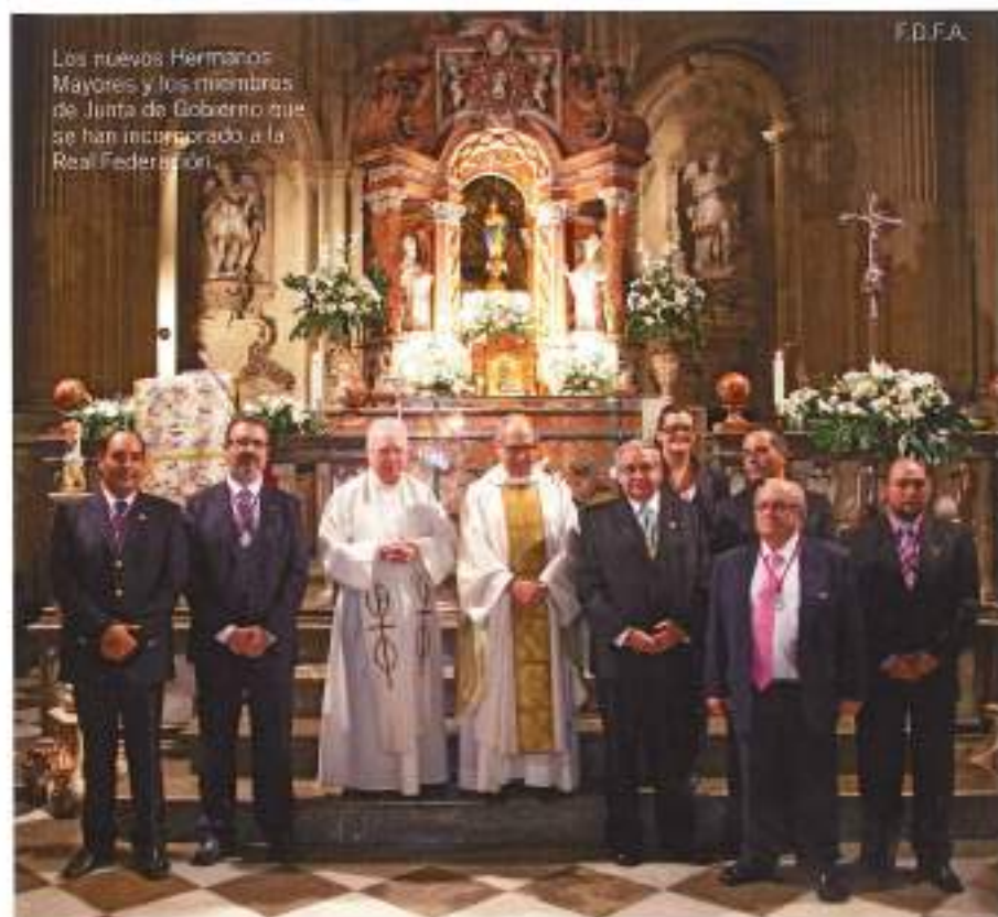
Los nuevos Hermanos Mayores y los miembros de Junta de Gobierno que se han incorporado a la Real Federación.