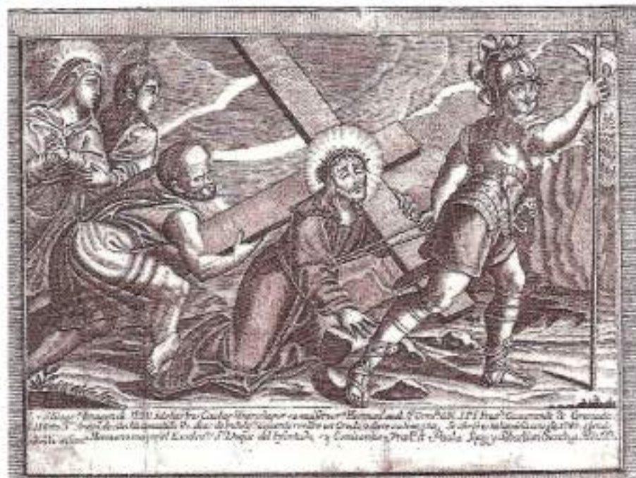
Litografía del archivo de la Casa de los Tiros. (1748)

«Pronto el pueblo identificó la imagen con este gremio de forma que lo llamaban “Padre Jesús de los Cocheros”»