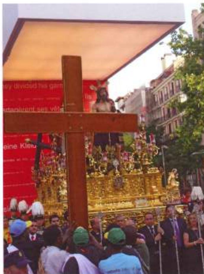
La cruz de la Jornada Mundial de la Juventud frente al paso de Jesús Despojado durante el rezo de la Novena Estación del Vía Crucis.

rior. Debemos llenar, como en Semana Santa, nuestras calles, nuestras familias, nuestro trabajo, nuestros entornos de la Luz de Cristo, como la JMJ ha llenado las calles de Madrid. Porque sólo siendo apóstoles, de palabra pero sobre todo de obra, y cumpliendo con el último mandamiento de Cristo antes de su Ascensión ("Id por todo el mundo y predicad el Evangelio") romperemos, siguiendo el llamamiento de Benedicto XVI, los muros de nuestro miedo y alcanzaremos la paz.