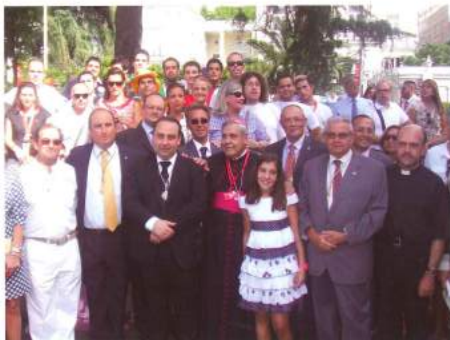
Las autoridades religiosas y civiles junto al Presidente de la Real Federación, el Hermano Mayor y numerosos cofrades, aquella calurosa jornada de agosto.