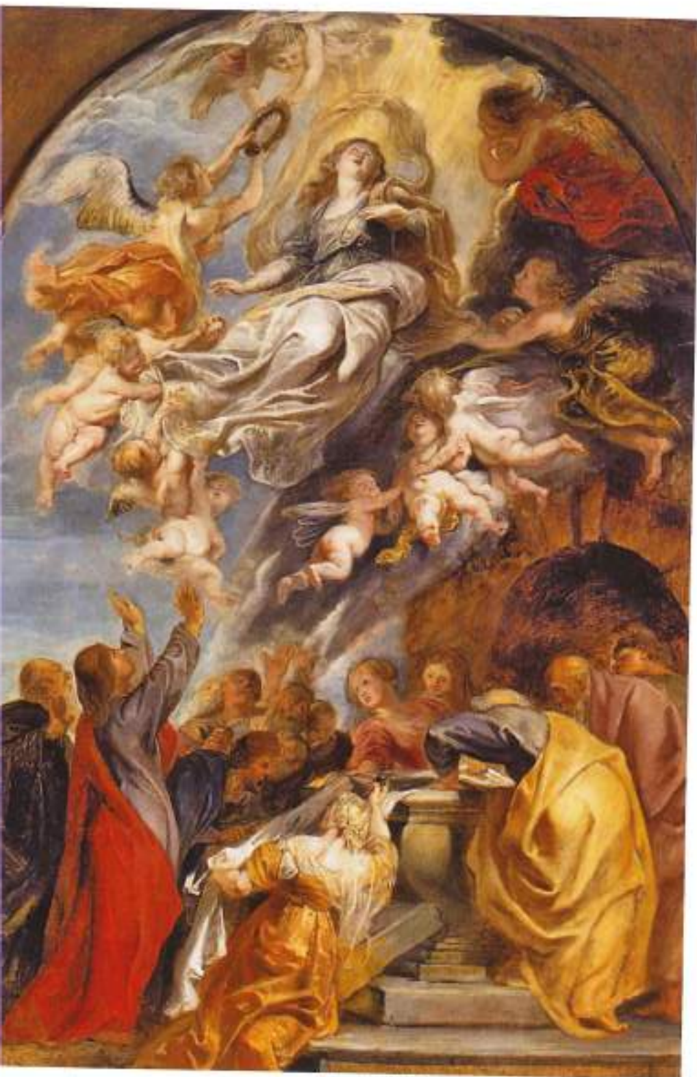
"Asunción de la Virgen María" de Peter Paul Rubens (1622).

«Convenía que lo hiciera, pues se trataba de la excelsa dignidad de su Madre.