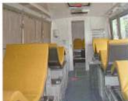
Una "Unidad móvil" de la Cruz Roja Española, para realizar campañas de donaciones en distintas localidades.

Y os aseguro que, por lo que he podido aprender de mis contactos con el personal de dicho Centro de Transfusiones, esto de la donación de sangre es algo verdaderamente importante para todos, se trate de la provincia que se trate.