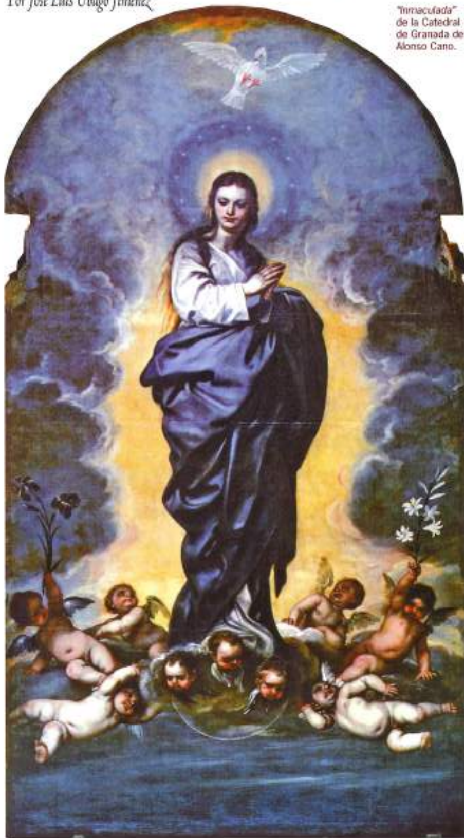
"Inmaculada" de la Catedral de Granada de Alonso Cano.