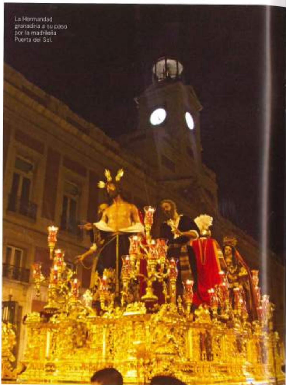
La Hermandad granadina a su paso por la madrileña Puerta del Sol.

Multitud de fieles esperan la llegada de Benedicto XVI.