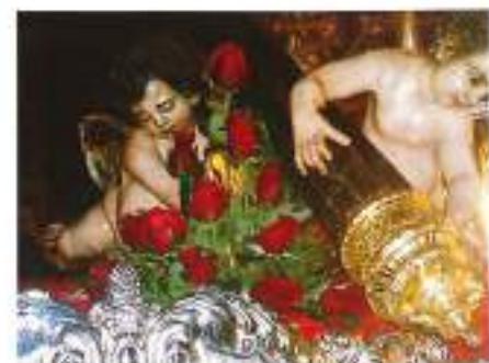
Horquilla del paso del Gran Poder.

Preguntados por las cofradías de hoy, echan de menos "mayor motivación" de los hermanos y "cierta dejadez" en muchas corporaciones. Ellos intentan contrarrestar esta tendencia con los premios Espinosa Cuadros que crearon para estimular el esfuerzo de cofrades por la Semana Santa. Algún año podrían concedérselo a sí mismos porque se lo merecen.