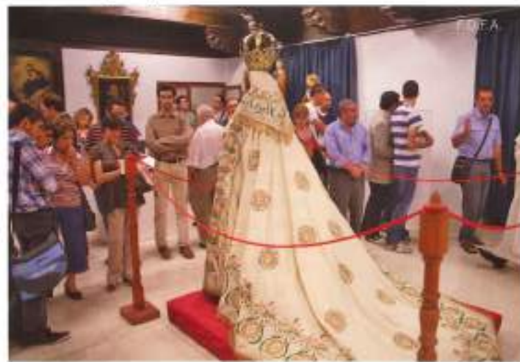
El Convento de los Dominicos fue el lugar elegido para albergar esta exposición.