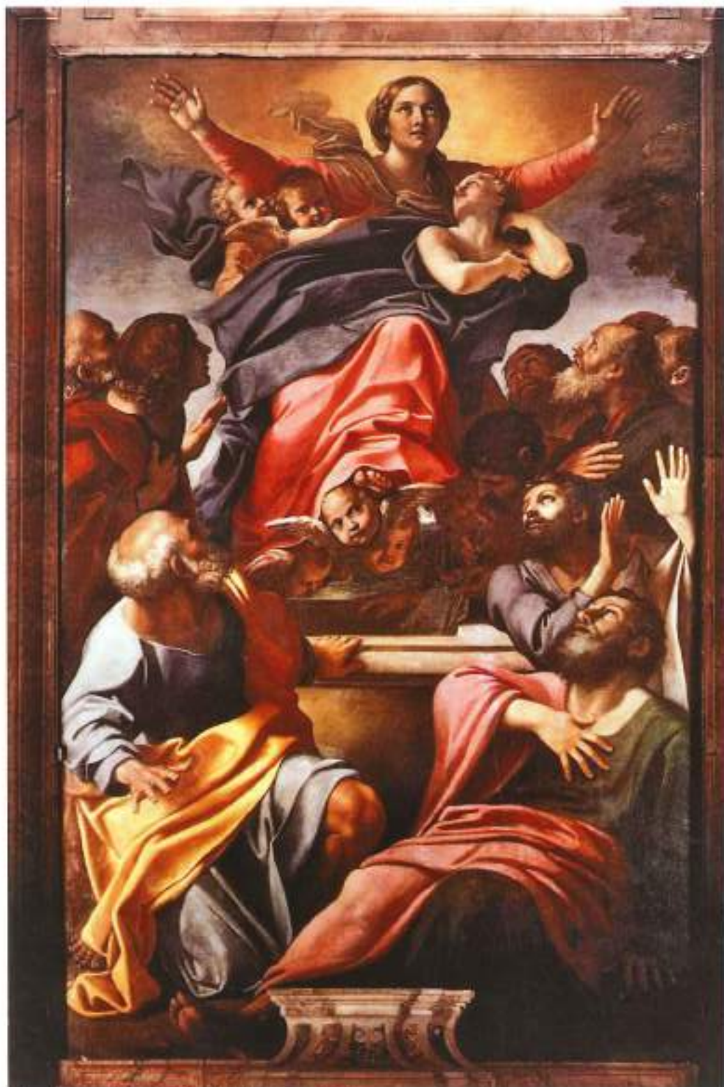
«Asunción de la Virgen María» de Annibale Carracci (1601).

Es por ello por lo que sin María no se puede entender a Cristo, su primogénito. Dios confía a María su bien más preciado, a su Hijo, y este a su vez señala a María como Madre de todos los hombres al pie de la cruz: «Madre, ahí tienes a tu hijo; hijo, ahí tienes a tu Madre». Y si María es Madre de todos los hombres, es por tanto Madre de la Iglesia.