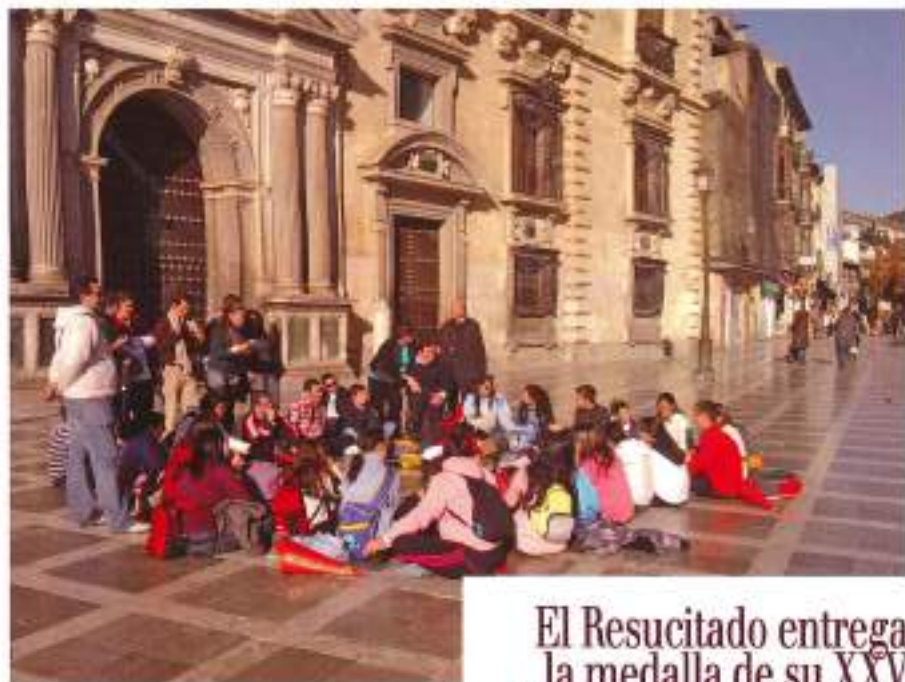
La Alhambra y Plaza Nueva acogieron la Gymkhana Cofrade.

Para finalizar el trimestre inicial la juventud cofrade se reúne para celebrar su festividad en el día de San Juan Evangelista el 27 de diciembre, celebrando la eucaristía en la parroquia de San Miguel Arcángel, y una fiesta de entrega de premios para los belenes galardonados y los ganadores de la gymkhana en los bajos de la misma parroquia, haciendo así posible una jornada más de convivencia entre la juventud cofrade, festejando su patrón y el nacimiento del Señor.