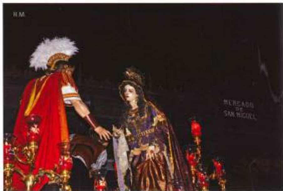
Imagen del paso regresando a San Isidro junto al Mercado de San Miguel.

Inolvidable la imagen de S.S. Benedicto XVI bendiciendo a todos los fieles y hermanos al comienzo y al final del Vía Crucis frente al altar de Nuestro Padre Jesús Despojado. Inolvidable la imagen de aquellos jóvenes católicos de los sufridos países de Ruanda y Burundi portando la cruz de la JMJ mientras un joven cantaba, rezaba, una saeta que nos estremecía el alma con Cristo en su Divina Pobreza al fondo, Despojado y doliente, maltrecho y humillado, dolorido y redentor. Inolvidable aquella novena estación en la que se pedía, bajo la mirada orante y entregada de nuestro Papa, por todos aquellos niños, ancianos, personas "despojados