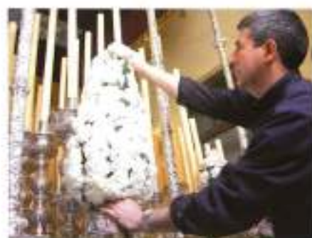
Jarras cónicas del palio de los Reyes.

«Son muchas las experiencias gratificantes que hemos tenido al montar la flor de un paso»