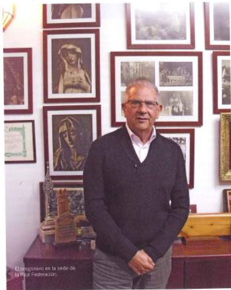
El pregonero en la sede de la Real Federación.

que ha sido su familia la que le ha animado a aceptar este reto, que para nada le vendrá grande, pues su afición por el teatro desde joven y su experiencia en la literatura y los pregones cofrades lo convierten en una segura apuesta para anunciar la llegada de la semana más esperada del año para los cofrades.